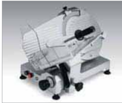
AFT 30S - AFT 30MS - AFT35 AFC 33S - AFC 33MS