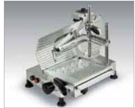
AFT 35VS - AFT30 VS - AFT 30VSM