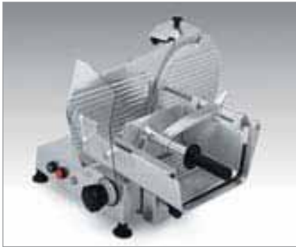
AFC 30S - AFC 30 MS - AFC 35