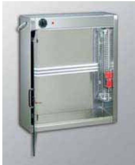
Sterilizzatore U.V.A. MOD. BSTER

Entrambi gli accessori sono da fissare a parete, o possono fissarsi su parete mod. PLM in acciaio inox 18-10 satinato da sovrapporre all'alzatina dei lavamani.